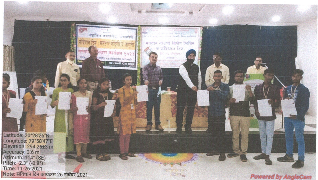
Students giving filled voter's registration forms